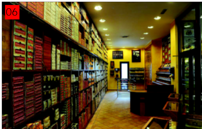
Cava principal de cigarros, donde se conservan en condiciones especiales de temperatura y humedad. Arriba, zona de entrada al establecimiento de la avenida Meritxell, en Andorra la Vella.