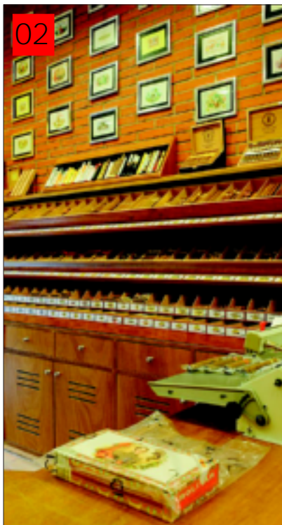
Zona de envasado.