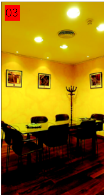
Conference Room para reuniones.